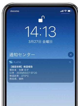
発熱時には労務管理担当者にプッシュ通知が届き、報告を確認できる