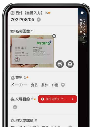
必須情報はアラートで入力漏れを防止