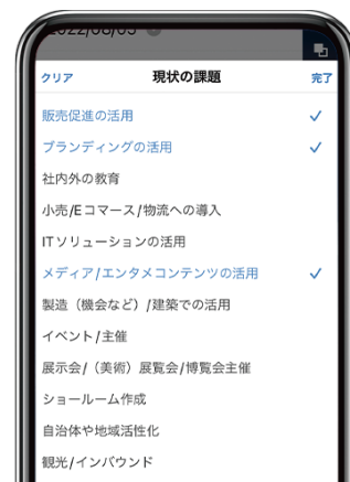
リストから複数の情報選択も可能