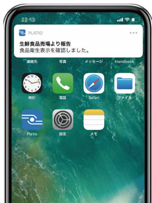
プッシュ通知画面